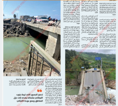
تدمير جسور الليطاني لمنع الإمدادات... (Caption text describing the bridge destruction)