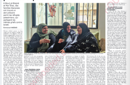
Les camps palestiniens, refuges paradoxaux pour les déplacés... (Caption text for the image)

À Beirut et Dajra et Mar Elias, des familles libanaises ont trouvé un abri précaire parmi les réfugiés palestiniens, qui partagent les mêmes grâces contra Israël. (Article text discussing the paradoxical nature of Palestinian camps as shelters for Lebanese displaced persons)