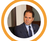
سامي جميل رئيس حزب الكتائب اللبنانية