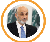
سمير ججع رئيس حزب القوات اللبنانية

إن جريمة السيارة التي كانت تضمّ جدّة وابنتها وأحفادها البنات الثلاث بشعة إلى أبعد حدود ومن الحكمة جدا الرجوع إلى القرار 1701 وتطبيقه لأنه الوحيد القادر على حماية لبنان وشعب لبنان