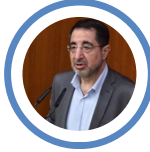
حسين الحاج حسن نائب في كتلة الوفاء للمقاومة

شهادات نعم، وشهود على الارهاب الأميركي الصهيوني والعجز والتواطؤ الدولي والعربي الرسمي، وتستمر المقاومة والله شديد الانتقام... دمكّن عزيز، سيهزم الجميع ويولون الدبر