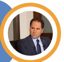
سامي جميل رئيس حزب الكتائب اللبنانية

البرلمان والحكومة غير موجودين والناس تنتظر السيد حسن ليتحدث وقد تأكدنا إلى أي حد لبنان مخطوف ولأي حد حزب الله يسيطر على لبنان