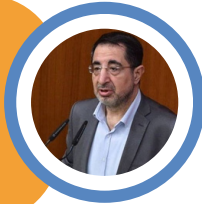
حسين الحاج حسن نائب وعضو في كتلة الوفاء للمقاومة

إفهموها جيداً، بالنسبة للجبهة اللبنانية مع العدو الاسرائيلي: كل الاحتمالات مفتوحة وكل الخيارات مطروحة في أي وقت!