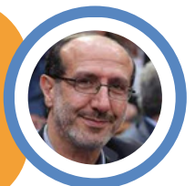
ابراهيم الموسوي نائب وعضو كتلة الوفاء للمقاومة

إفهموها جيداً، بالنسبة للجبهة اللبنانية مع العدو الاسرائيلي: كل الاحتمالات مفتوحة وكل الخيارات مطروحة في أي وقت!