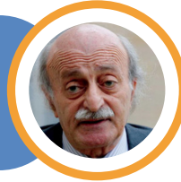
وليد جنبلاط الرئيس السابق للحزب التقدمي الاشتراكي

أقول لنصرالله إنه أتمنى ألا ينزلق لبنان إلى الحرب حرصاً على لبنان وأهل الجنوب، وهو مُدرك لهذه المعاناة على ما أعتقد والمطلوب ضبط النفس