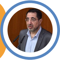
حسين الحاج حسن نائب وعضو في كتلة الوفاء للمقاومة

"...قل ما شئت سيدي.. هدد أو هددى.. فقط أطل على قلوبنا لترتوي بالوصال بعد الجوى"