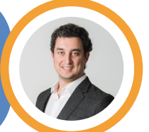
مارك ضوّ نائب في البرلمان اللبناني

ما يجري في لبنان غير مرتبط بمجريات الأحداث في غزة بل مرتبط بأجندة إقليمية ترضى مصلحة إيران