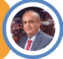
ونام وهاب رئيس حزب التوحيد العربي

كل الحملة التي يقوم بها البعض على السيد مدفوعة الأجر، إذا مش عاجبكم حجم تدخل الحزب، الجبهة مفتوحة للجميع صعدوا وشاركوا أو سدوا بوزكم لأن كلنا منعرف انتو مع الإسرائيلي