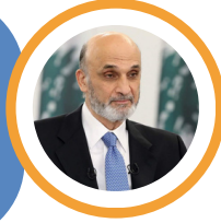
سمير ججعج رئيس حزب القوات اللبنانية

أفضل لو السيد حسن ينسحب من الجنوب وييسلمه للجيش بدلا من أن يلقي كلمته غدا وأفلامه الدعائية "ما كان وقتها"