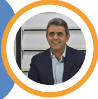
زياد حواط نائب في تكتل الجمهورية القوية

حذرنا في الانتخابات من خطورة مشروع الممانعة ونحن اليوم نحصد النتائج